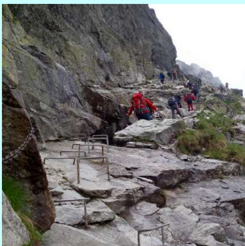
"Prosto ko pasulj"

Markiranom stazom preko Žabljeg jezera stizemo do planinarskog doma na najvišoj visini (2225) u Slovačkoj. Odmaramo se i sakupljamo snagu za završni uspon na najviši vrh Poljske, koji se nalazi na granici Slovačke i Poljske.