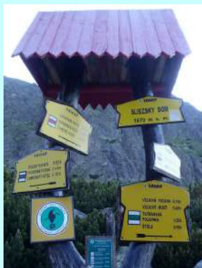
Polazna tačka za uspon

Sutradan nas je čekao još veći izazov, uspon na najviši vrh Slovačke - Gerlahovski štít-2655m. Uspón smo izveli sa profesionalnim vodičem Slovačke, drugačije se ne može. Rendžerska služba nacionalnog parka nedozvoljava uspón na neobeženim stazama bez vodiča. Znali smo da nas čeka desetočasovni uspon i silazak. Krenuli smo od Šleskog doma (1670m) obilazeći Veliko jezero i vodopad.