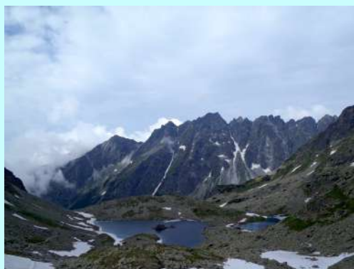
Lednička jezera na svakom koraku

Markiranom stazom preko Žabljeg jezera stizemo do planinarskog doma na najvišoj visini (2225) u Slovačkoj. Odmaramo se i sakupljamo snagu za završni uspon na najviši vrh Poljske, koji se nalazi na granici Slovačke i Poljske.