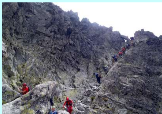
Na slici izgleda prosto