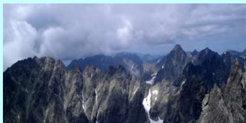
Pogled na Tatre