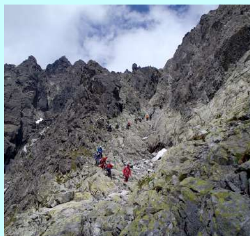
Ostalo je jos malo

Sišli smo sa Gerlaha u Batizovsku dolini. Na kraju stene i najeksponiraniji detalji sa vertikalama i do 90 stepeni. Konacno se raspojasamo i normalnom stazom za dva sata stizemo na pocetnu tacku uspona gde nas je cekao bus.