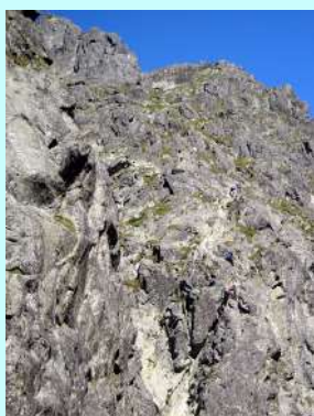
Stena odakle pocinje uspon

Skrenuli smo sa marekirane staze ka poljskom grebenu levo do podnožja stena. Dalje se uspon izvodi u navezama sa kompletnom opremom za visokogorsko planinarenje. Krenulo je 20 planinara sa vodičem u šest naveza.