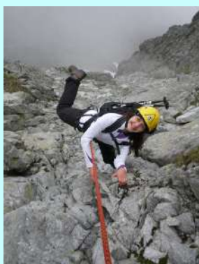
Najmlađi učesnik akcije

Vreme sunčano. Na početku uspona čekala nas je oklinčena stena koja je usporavala naše napredovanje ka vrhu. Nakon pregrupisavanja lakše smo savladali narednu etapu do ivice grebena.