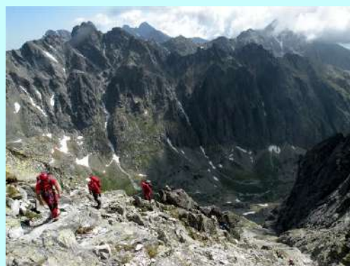
Detalj sa uspona