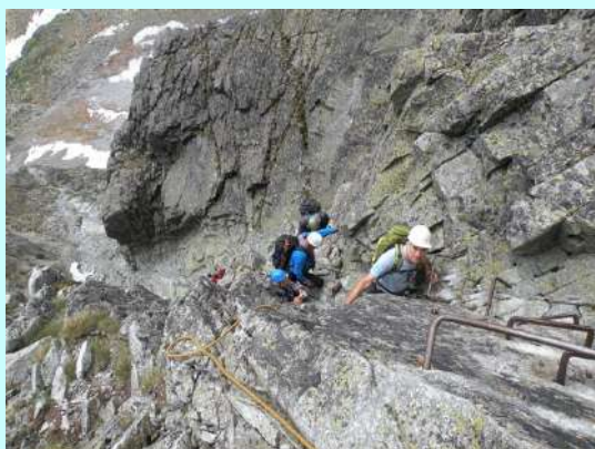
Najteži deo pri spuštanju

Nakon osvezenja na vrhu ponovo se vracamo, najpre isto stazom, pa novom nama nepoznatom. Stalno smo maksimalno skoncentrisani na silazak i nedozvoljavamo opuštanje u grupi. Pojedine detalje krajnje oprezno odpenjavamo uz medjusobno osiguravanje partnera.